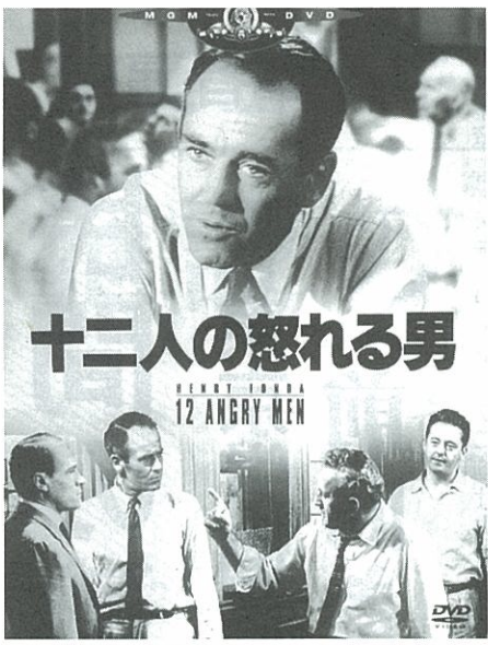
「12人の怒れる男」DVDのジャケット(20世紀フォックスホームエンターテイメントから発売中) 4,179円。

新聞界では「NIE」が定着している。ニュースペーパー・イン・エデュケーション。「教育に新聞を活用しよう」という運動だ。新聞を読んで世界の動きを知る。社会問題を考える。