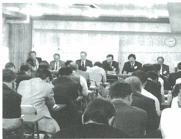
BERCの04年度活動方針説明会

BERCの04年度会員オリエンテーションが3月15日、東京・中央区の東洋経済新報社で開かれた。今回は04年度研究部会、研究会に関する運営方針について説明があった。BERC