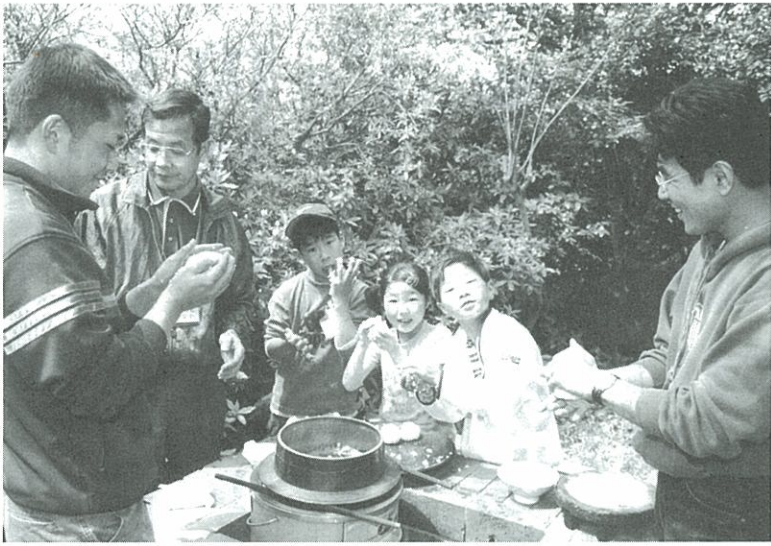
楽しいおにぎりづくり 福岡県・能古島アイランド・パークでのキッズ・プロジェクト。お釜で炊いたご飯を食べよう…と、皆一緒ににおにぎりづくり。招待されたのは和白青松園の子供たち。(2001年4月)

もうひとつは、自分の仕事や製品に対する誠実な気持ちが必要だ。三菱欠陥をすぐに改めるはずだ。そうしないのは、本当のモノ作りとは言えないのではなかろうか。(朗)