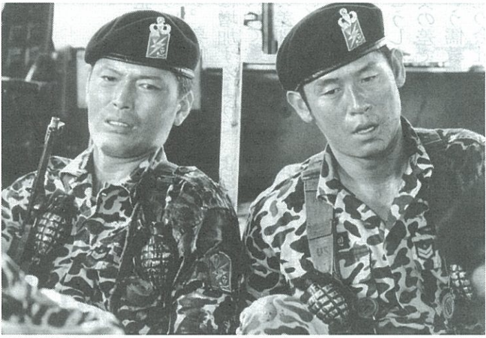
「シルミド」の一場面。韓国では初めて一千万人を超す観客を動員する大ヒットになった

ことしのカンヌ映画祭は、反ブッシュのアメリカ映画「華氏911」と、十四歳の最優秀男優賞をはじめとす