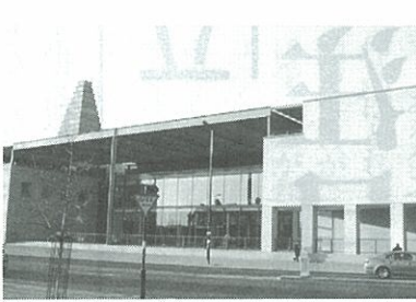
オックスフォードのビジネス・スクール

「オックスフォードとケンブリッジに度々行くようになった。一九九三年の初頭の「考える会」の例会でそれをメンバー諸兄に語り多くの賛同を得ることができた。