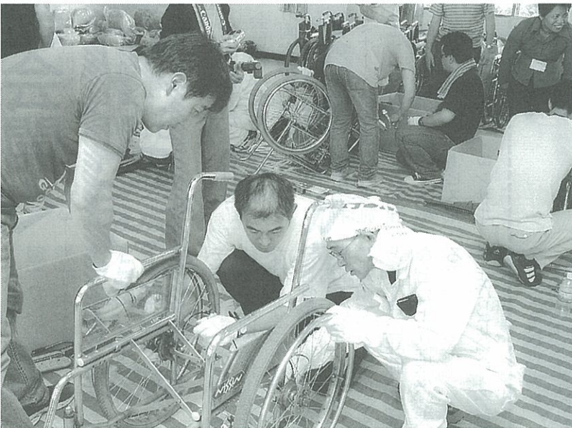
リピートホットラインinタイランドに参加、現地で車いす改造に汗を流すボランティア活動の組合員ら

「本田技研労働組合」は、一九九三年に設立された。同組合は、社会貢献活動基金(五億円)を設立し、車いすの修理・改造ボランティア「ホンダリピートホットライン」を運営している。