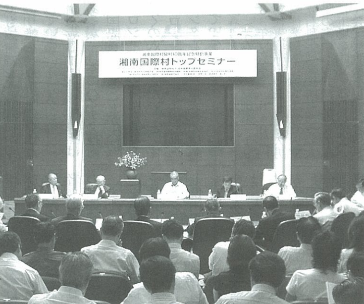
開村10周年を記念して開かれた湘南国際村トップセミナー

(CSR)の今日的課題」と題して基調講演。同会長は、この中で①「21世紀は経営倫理」の時代②企業の社会的責任とステークホルダーズ・マネジメントの推進③環境問題への企業の取組みと社会性原理の実現などを柱としたスピーチをした。