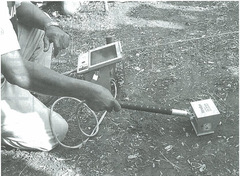
マイン・アイ(手前右側)を握っての地雷探知作業。左側奥のモニター画像を見ながら操作する。