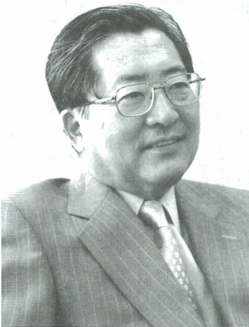
たけなか・とういち 岐阜大学農学部卒業。1964年、山之内製薬入社。2000年4月、社長就任。2005年4月、藤沢薬品工業と合併、アステラス製薬社長に就任。