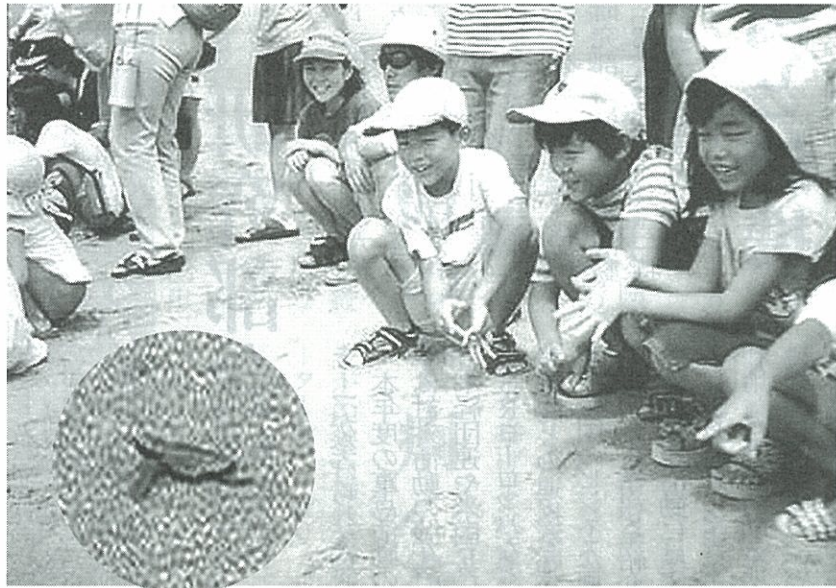
ふ化したばかりの子ガメ(円内)を海へ放す子供たち

〇〇四年には千二百人以上から募るなど、呼び掛けの対象を拡大したことが成功した。参加は社員とその家族や友人。子供達が参加しやすいように、会場を磐田市と浜松市の遠州灘海岸2ヶ所に設定した。さらに参加者をヤマハグループ全体