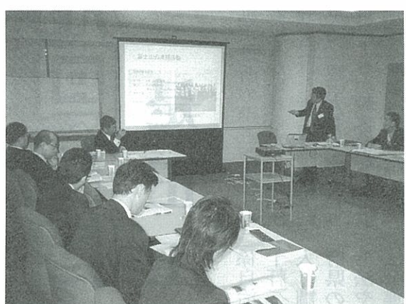
関西CSR研究会(和ハウス)事例発表の企業事例発表

社会貢献活動推進のため社内にも新しい制度を導入し、変更した企業は百社(22%)。その具体的な動きとして、①基本方針の明文化②専門部署または専任担当の設置③社内横断的推進組織の設置など。