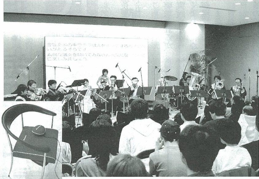
手話通訳と字幕スクリーンも使用しての演奏会(5月28日、パイオニア本社ロビー)左下は障害者が使用する体感音響システムの座席シートとハンディパッド

「聴く」には、身体全体で音の振動を感じることで、この装置開発を契機に、ボランティア活動として推進することを社員たちが提案した。さらに、聴覚障害者団体の協力も得て、音楽会がスタートしたのは一九九二年。随時開催されるこの音楽