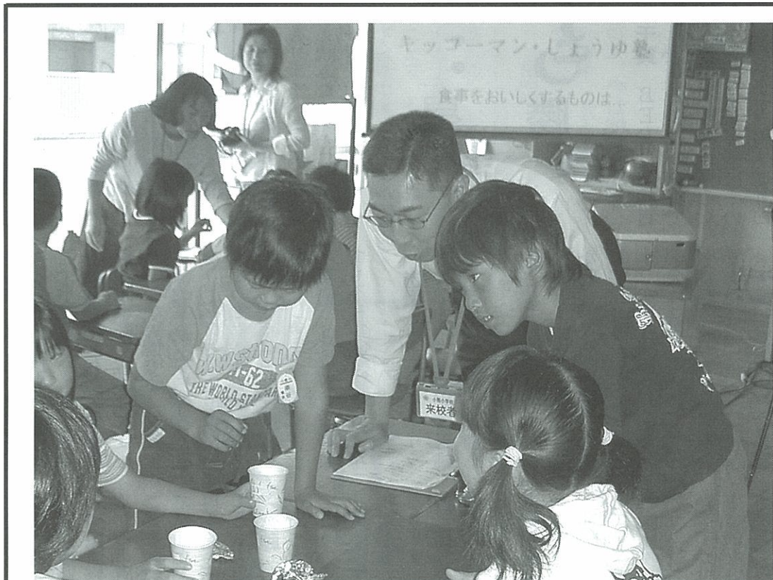
子どもたちと作業するキッコーマン社員ボランティア。日常、目にするものの少ないしょうゆの原料に興味が集まっていた

納豆を食べるとやせられるという触れ込みのテレビの健康番組が、肝心のデータ類を捏造して放映されていた。テレビ会社社長らが謝罪、長年高い人気を誇った番組は打ち切りとなった。高視聴率を得ようとして劇的な効果を求め、それが果たせず捏造に手を染めた。チ 「発掘」あるある大事典Ⅱ」関西テレビが制作し、「納豆にダイエット効果」は1月7日夜に放映された。主な内容は次の通りだった。納豆を毎日朝晩2パック、よくかきませ20分置いてから食べる。そうすると、体内でつくられるホルモン