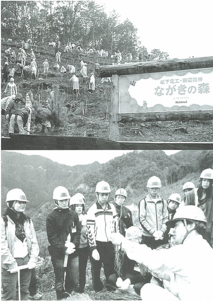
①山肌で300人が植林。右に「ながきの森」の看板②森林組合員（右）が植林の介添えをする新入社員に苗木植えを指導

同社では2001年から 緑の恩返しとしてアジア諸 国での植林支援も続けてい る。07年9月までに6カ国 33地域で、9樹種について 苗木累計総数は30万本に 達している。住宅部材メー カーとして木材加工製品を 多く販売していることから、 自然への感謝と還元という