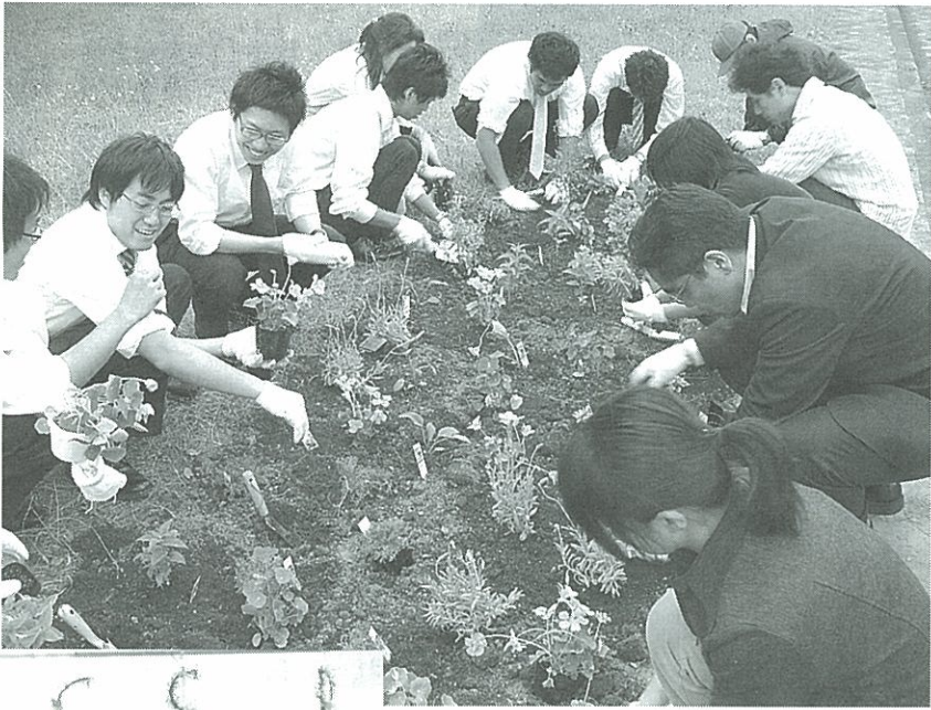
④新木場駅前花壇づくりで汗を流すNECソフトの社員ボランティアたち ⑤収穫したハーブはサシェ(匂袋)、ハーブキャンドル等に加工される。NECソフトの一階ロビーで展示されているハーブ類。