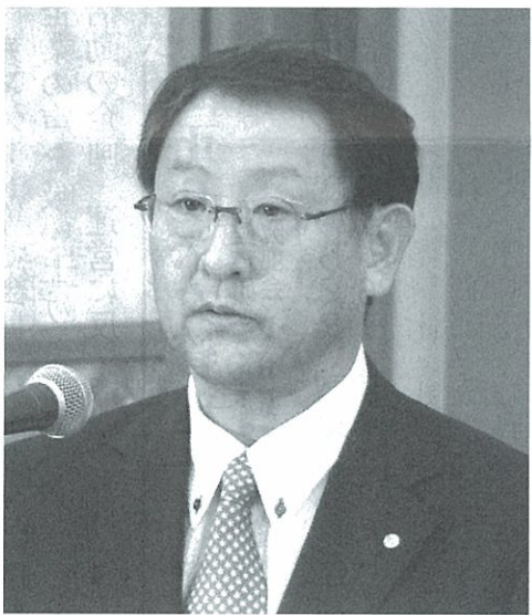
日本記者クラブで社長就任後、初の記者会見をする豊田章男氏＝09年10月2日

判が始まって以降、実際に裁判員として参加した経験者らを対象にアンケート調査が行われ、結果がまとまった。サラリーマン等の勤労者や、事業所そのものへの負担も少なくない、