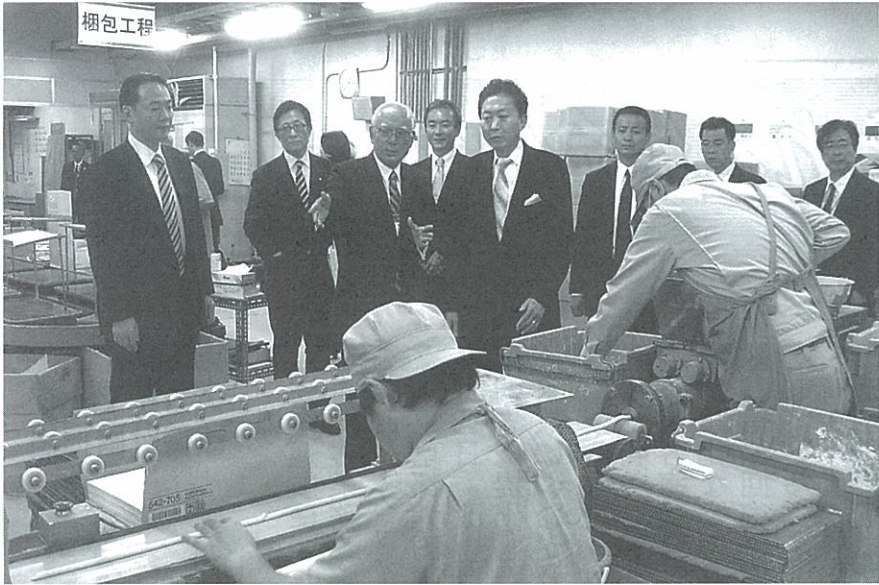
鳩山由起夫首相(中央)も視察に訪れた日本理化学工業の工場=昨年10月

神奈川県川崎市高津区内にある工場、整然と並べられた機械と机の風景は一見、どこにでもある製造工場と違いがない。しかし細かく見ていくと、場内に砂時計が置かれていたり、重さを量るおもりに色が塗られているなど、少し変わった感じがする。