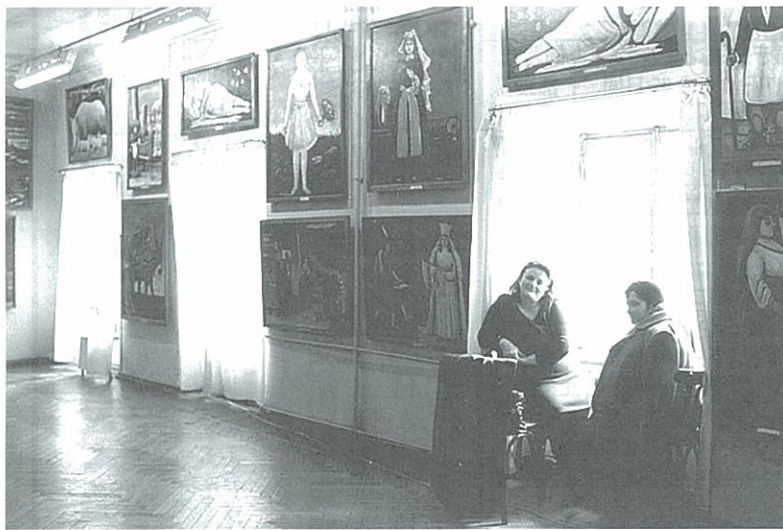
ピロスマニの絵が並ぶ美術館1990年、グルジアの首都トビリシで