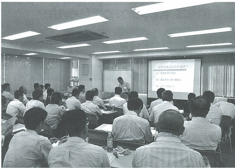
会場は満席の新任監査人セミナー = BERC セミナー室で