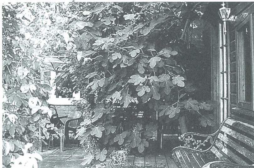
ロレンスがかつて住んだ家に残っていたイチジクの木。中東から持ち帰ったといわれる。1999年夏、英国オックスフォードで